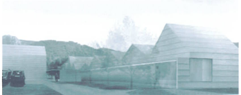
Pirineando. Diseño en coherencia con la tipología de la zona. Incluye espacios destinados a locales y oficinas, en una estructura de hormigón prefabricado con sistemas de control térmico y medidas energéticas de carácter pasivo.

En este sentido, la construcción de los centros polivalentes es una de las demandas de las entidades locales incluida como proyecto emblemático dentro del Plan del Pirineo y financiada por el Plan Navarra 2012. "Su creación surge de la falta de espacios en los que aunar servicios que se están ofreciendo de forma dispersa o que todavía no existen en la zona", explican desde el Gobierno foral.